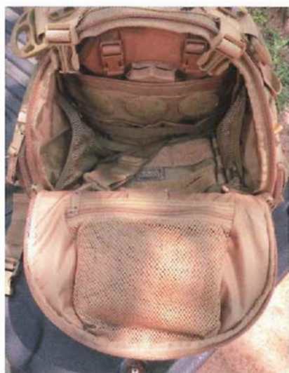
Le Braco permet l'ouverture 1/3 du sac. Là encore, on notera la présence d'une poche filet zippée sur le rabat.