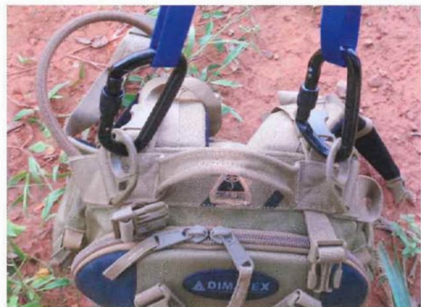
Deux anneaux de fixation pour hélitreuillage ont été montés sur le sac. Ils peuvent aussi servir pour les opérations de franchissements par corde en y fixant des mousquetons couplés avec un anneau/sangle ou une corde.

3 jours. Nous insistons sur l'adjectif de moderne, car nombre de sacs actuels disposent de sangles de compression qui permettent de réduire le volume du sac en fonction de son contenu.