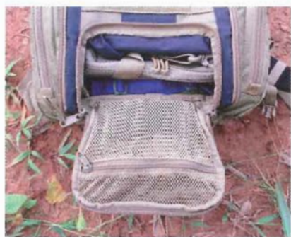
Les dimensions correctes de la poche d'accès au fond du sac facilitent les opérations de retraits et d'introductions de matériel. Poche d'accès ouverte. On remarque la présence d'une poche filet zippée sur son rabat.

Le sac Dimatex Braco est un sac dont le volume d'emport est de 33l. Pour nous, les sacs modernes avoisinants 35l sont les sacs les plus intéressants. La première raison tient au fait que vous pouvez les prendre partout avec vous quel que soit le mode de transport utilisé. Si vous devez voyager en avion pour pourrez l'avoir en cabine, car les dimensions, variable selon les compagnies, des bagages cabines correspondent à celles d'un sac de 35l. Bien entendu, vous devrez laisser vos Tools et autres couteaux de combat en soute. Votre sac 35l pourra vous suivre dans un bus, dans un train etc... Vous pourrez le garder à portée de main et donc le prendre avec vous si vous devez évacuer en urgence ledit véhicule. Pour nous, un sac tactique moderne de 35l est l'idéal pour des déplacements de