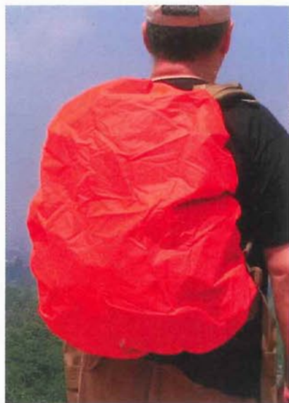
Une housse de protection contre la pluie réversible noir/orange est livrée avec le sac.

choses avec eux qu'ils n'en ont l'utilité. Autrement dit, nous sommes incités à nous servir de sacs plus volumineux que nous n'en avons réellement l'utilité. Par exemple, les vendeurs de sacs de randonnée considèrent qu'un sac 1 jour est un sac de 40l ce qui pour nous est trop. N'oublions pas qu'il faut porter le sac et donc plus on le remplit et plus il pèse. L'un des mots qui semblent avoir été oubliés lorsqu'on évoque la randonnée, la survie et tous les types de déplacements avec un sac sur le dos est celui de rusticité. De ma vie, je n'ai jamais utilisé un tapis de sol en mousse et je n'en suis pas mort ni n'en porte les séquelles. Lorsque je remarque dans la liste des affaires obligatoires à avoir,