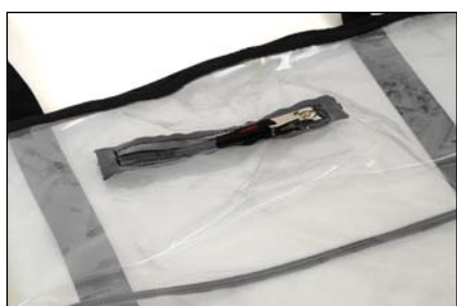
Ouverture pour perfuser

Préserver la chaîne d'évacuation de la contamination