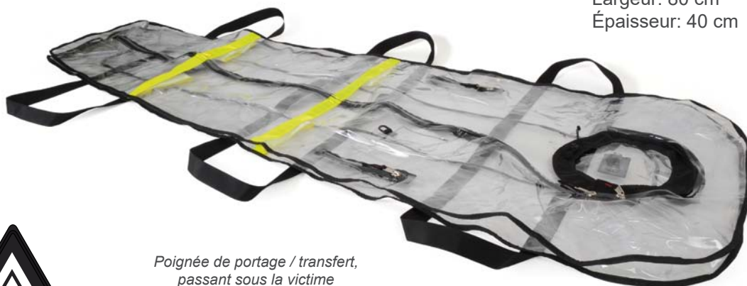
Poignée de portage / transfert, passant sous la victime

Longueur: 206 cm (165cm jusqu'au cou) Largeur: 80 cm Épaisseur: 40 cm